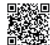
Таблица калорийности блюд