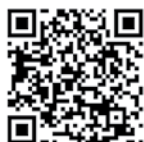
Таблица калорийности блюд

✂ Блюдо не содержит глютен 🌿 Можем приготовить без глютена Для компаний от 8 человек вводится сервисный сбор в размере 10% от суммы счета.